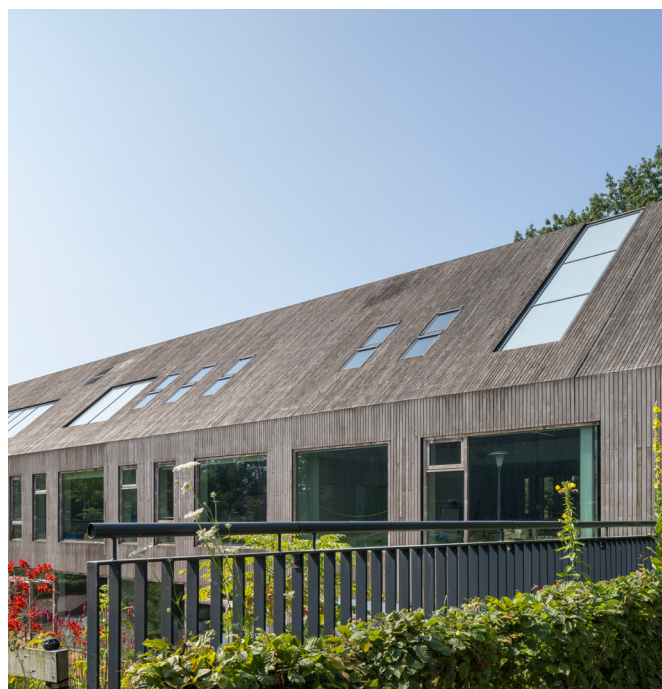
KRAAIJVANGER ARCHITECTS

La plupart des produits de nettoyage du bois du commerce conviennent à l'Accoya®, à l'exception de ceux ayant un pH de 9,0 ou plus. L'utilisation de tels produits sur l'Accoya® annulera sa garantie. Il est recommandé de tester une petite zone avant une utilisation complète. Notez que certains produits peuvent décolorer le bois s'ils sont appliqués en excès.